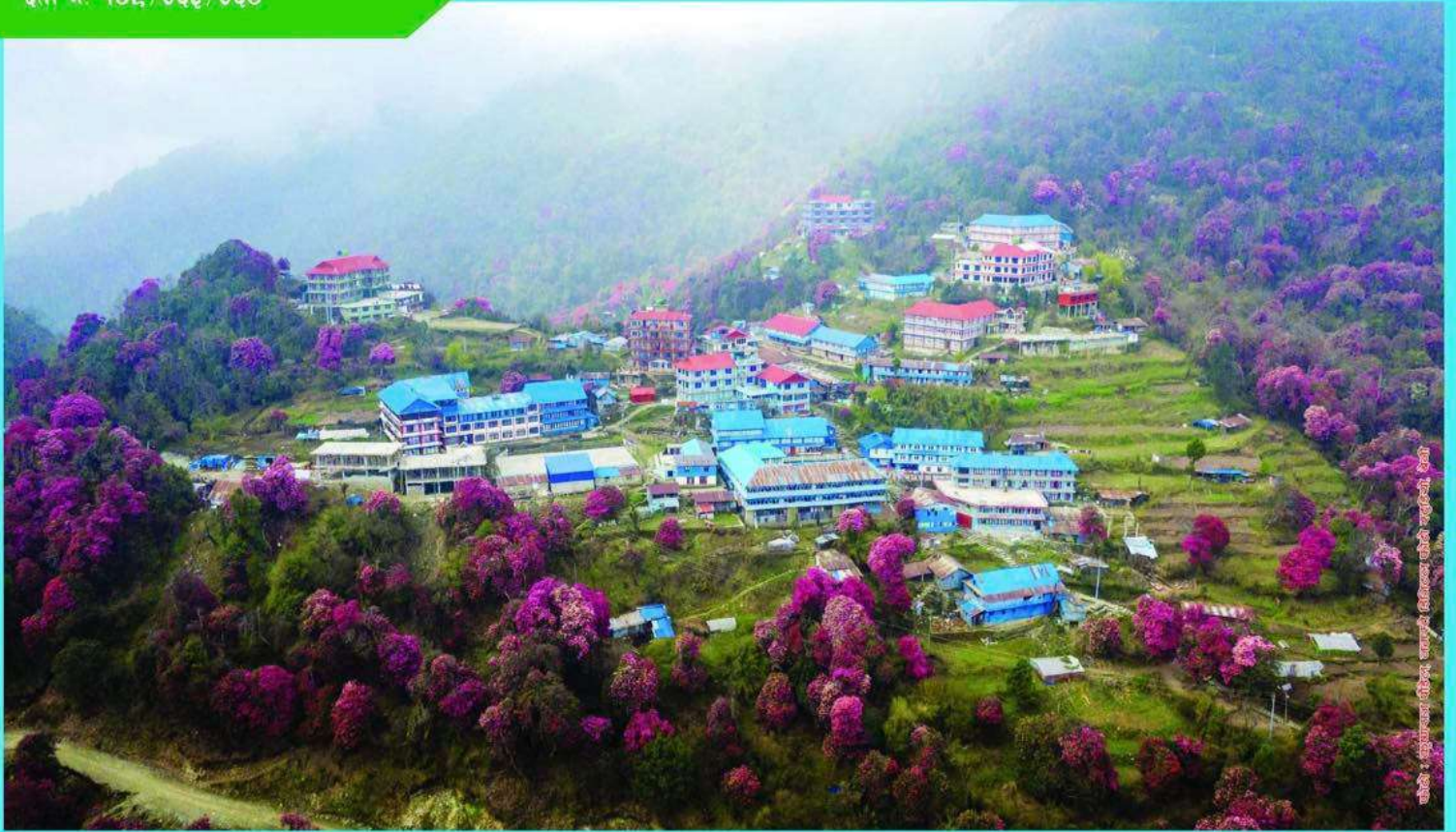
पर्यटकीय स्थल घोरेपानी