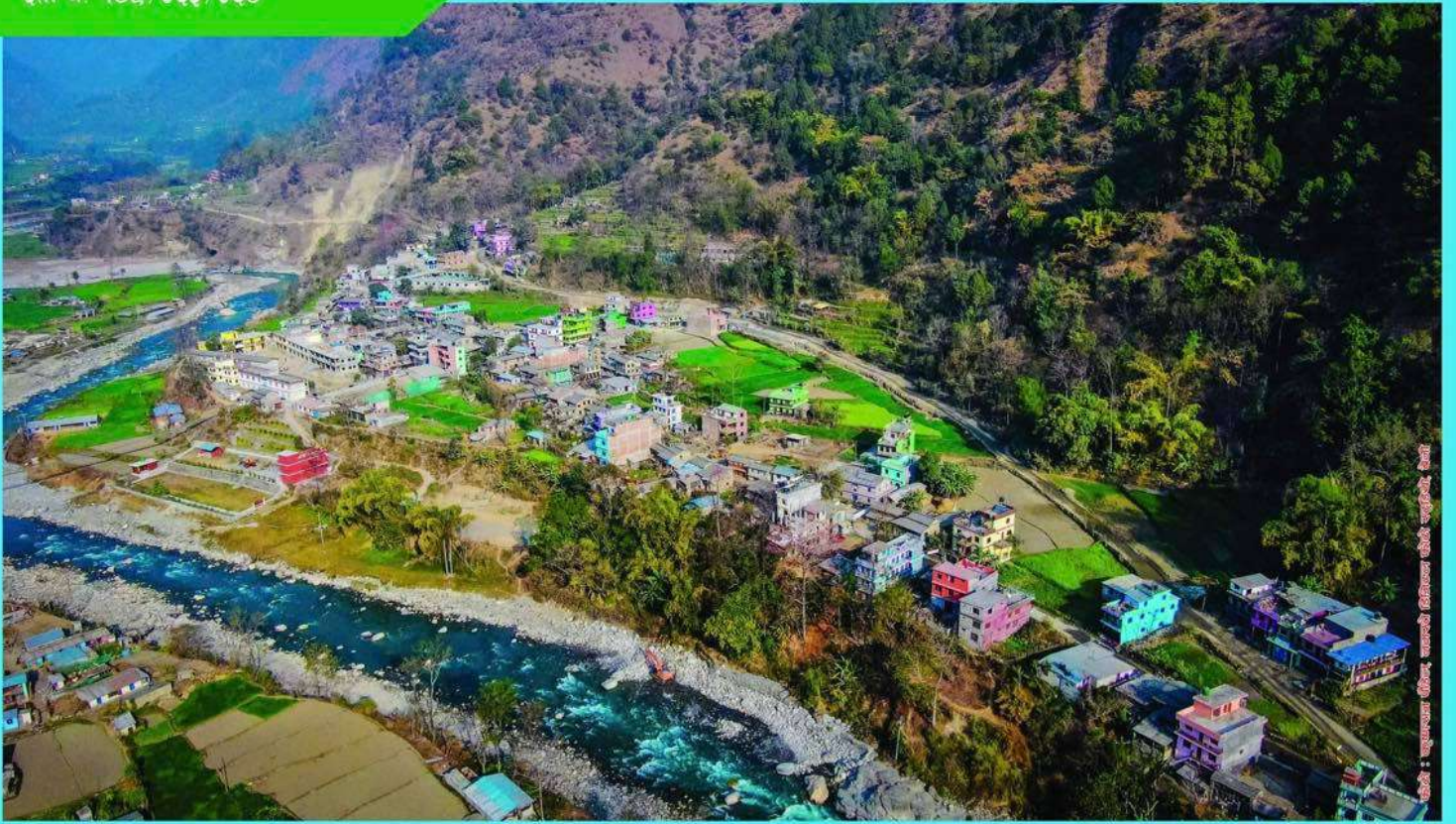
मंगला गाउँपालिकाको केन्द्र बावियाचौर बजार