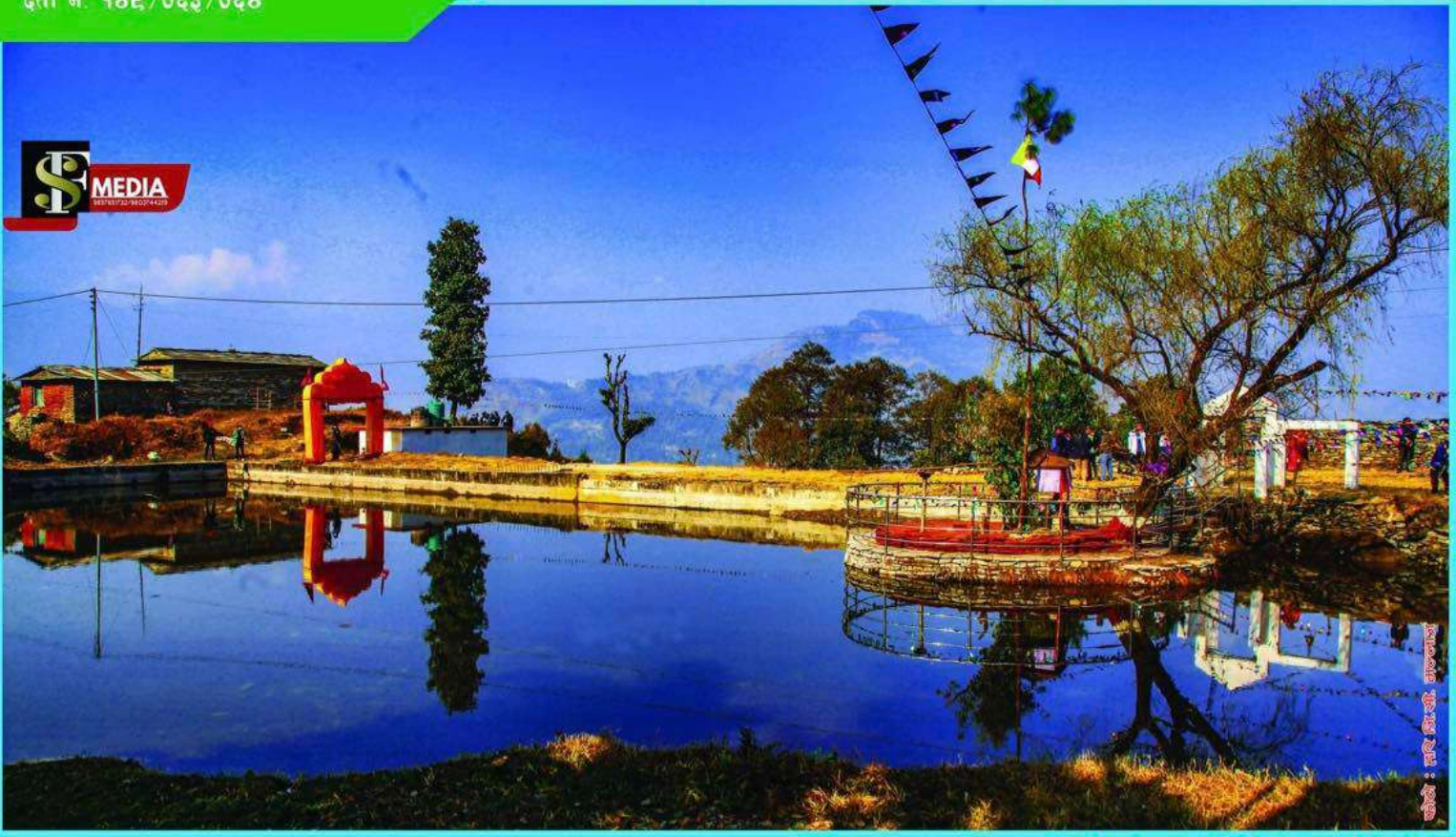
रमणिय मल्लाज गाउँ जलजला-३, पर्वत